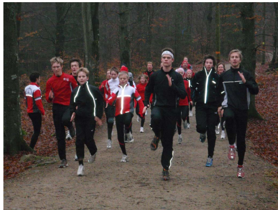
Löpskolningsövningar hos Hässleholms OK