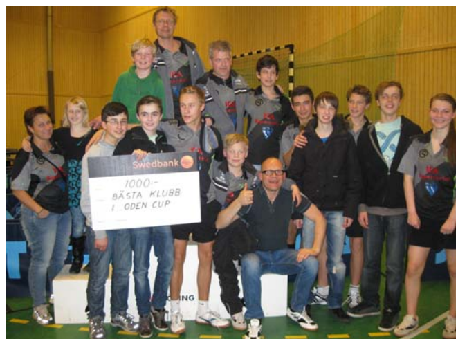
Vaggeryds BTK blev "Bästa klubb" 2011

spelas helgen 31 mars – 1 april 2012 med lag- och singelspel. Lämplig avslutningsresa för hela klubben med billiga mat- och logialternativ. VÄLKOMNA!